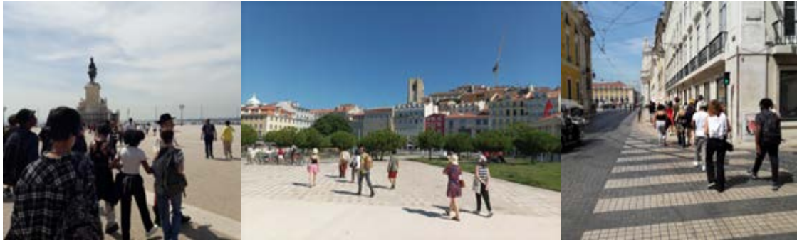
Figura 1 Participantes na caminhada. Público generalista e turmas de escolas.