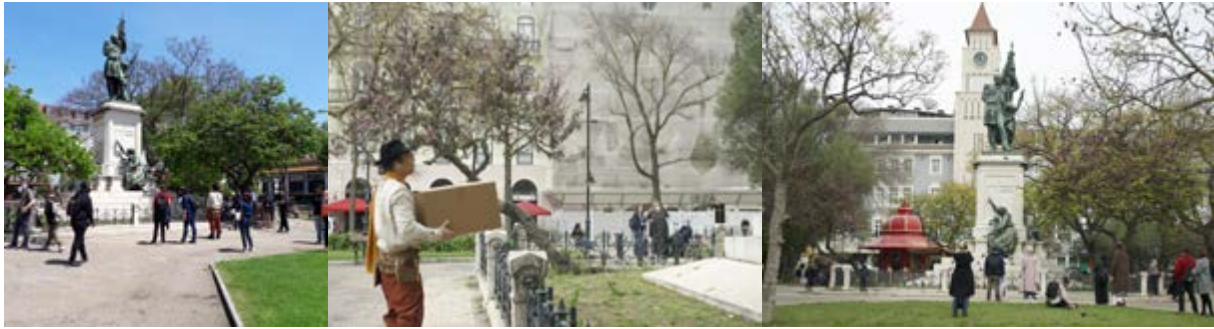
Figura 9 Ritual final em frente à estátua de Sá da Bandeira.

O último quadro do registo áudio é o de um chamamento com um djembé 7 . Depondo o caixote aos pés da estátua, o cicerone afasta-se rapidamente do grupo. Quando o cicerone se afasta os participantes retiram os seus auriculares, uma vez que o som silencia, mas, ao tirá-los escutam um outro djembé que está a ser tocado ao vivo, que se pode escutar à distância. Somos devolvidos à cidade contemporânea, no entanto, fica um eco diegético ressoando, um ritmo cujo signo é o de resposta ao toque inicialmente ouvido na composição sonora.