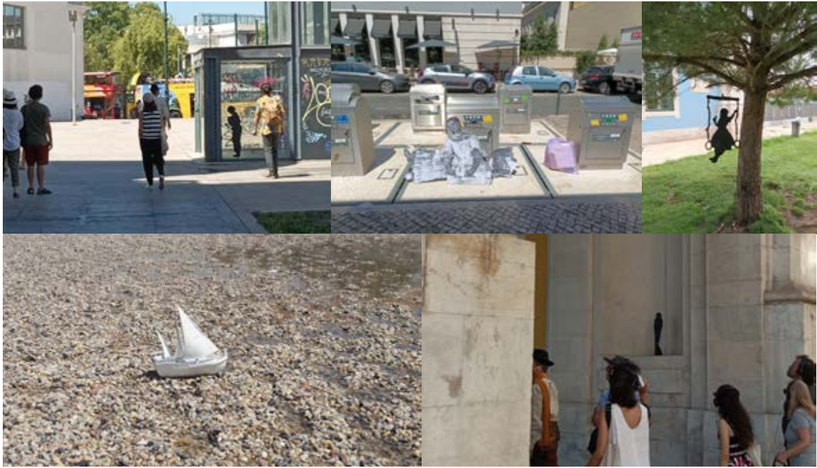
Figura 5 Adereços de cena surgem integrados na paisagem.

Traços do passado interrompem o tempo do presente. Ativamos aquele espaço com a deslocação dos nossos corpos e a presença de memórias traumatizadas. Procuramos aprender com a experiência e os fantasmas. Do lugar do antigo pelourinho, o grupo dirige-se até ao antigo Terreiro do Paço (real), a atual Praça do comércio. No centro da praça, enquanto escutamos anúncios de pregões relativos à venda de escravos no século XV e XVI (retirados de periódicos da altura), o cicerone, um pouco inesperadamente, remete-nos para o presente. Apresenta uma sequência de tabuletas com factos e dados estatísticos relativos à escravatura moderna — estabelecendo uma ponte com um assunto que ocupou algum espaço na agenda mediática portuguesa neste último ano: as condições de trabalho degradantes da imigração oriunda da Ásia e do leste da Europa para trabalhar em condições sub-humanas em latifúndios do Alentejo e a escravatura moderna em Portugal.