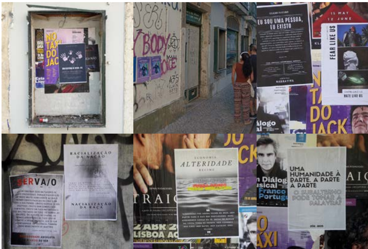
Figura 8 Exemplo de cartazes.

Uma assombração pode ser entendida como uma dobra de um tempo perturbando outro. Derrida usou o termo Fantologia para se referir à capacidade de Marx assombrar a sociedade ocidental contemporânea 6 . A Fantologia seria, então, a persistência no presente de elementos do passado na figura do espectro. Mas, mais determinante, o espectro teria ainda um entendimento de porvir, uma disjunção temporal que obedece a uma vontade de enunciar uma transformação no presente. Um passado-futuro. Um fora de tempo. O caso paradigmático do fantasma é, claro, o do pai de Hamlet aparecendo no castelo de Elsinore promovendo a sua vingança. O que parece pacificado e encerrado, num tempo, surge como ameaçador noutra. Da obsessão resultante do apagamento da memória emergem fantasmas diz-nos Paul Ricoeur (Ricoeur, 2004/2000). Serão a escravatura e a alteridade esses fantasmas?