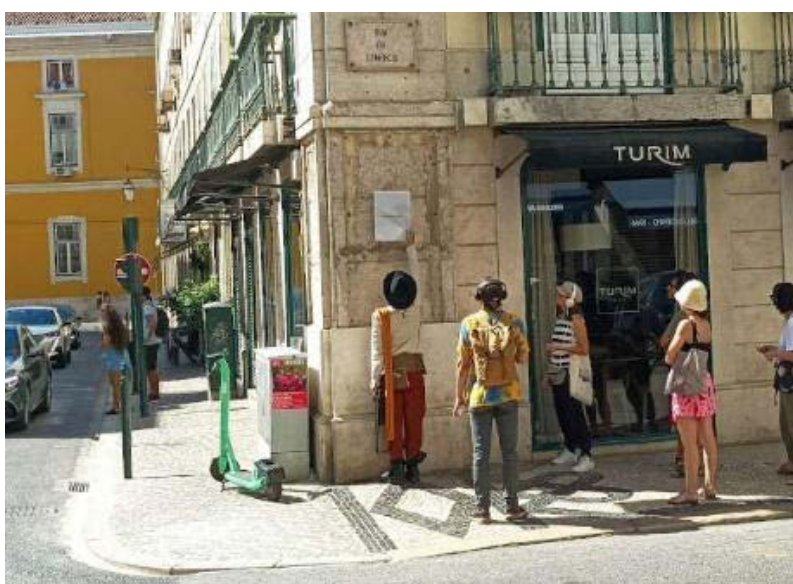
Figura 4 Ritual na zona onde se localizaria sensivelmente o pelourinho velho, local de venda de pessoas escravizadas durante o período pré-terramoto.

Este lugar que foi derrubado com o terramoto e reerguido com novas edificações, torna-se agora, momentaneamente, um lieux de memoires (Nora, 1996/1984), um espaço físico onde um evento significativo teve lugar, mas que também pode tomar forma num arquivo, evento memorial, ou reenactment . Os lieux de memoire emergem da compreensão de que não há memória espontânea. Sem vigilância, certos eventos são arrastados para fora do contínuo da história. O lieux de memoire devolve esses eventos ao fluxo histórico “já não vivos, mas também não inteiramente mortos, como conchas na praia quando o mar da memória viva recedeu” ( id. 6).