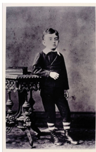
Figura 4 Ndugu M'Hali e Calouste Gulbenkian