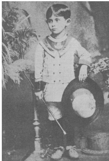
Figura 3 Franz Kafka e Walter Benjamin | ©Klaus Wagenbach, © Carl Hanser Verlag

No texto A Mummerehlen , Benjamin (1987b) descreve uma fotografia de si mesmo quando criança — feita em 1897, no estúdio Selle & Kuntze, em Potsdam —, mas o relato se confunde com a descrição de outra fotografia que carrega o mesmo páthos (figura 3), para utilizar a perspectiva de Aby Warburg: a outra imagem evocada por Benjamin na enunciação quase onírica é uma fotografia de Franz Kafka, com aproximadamente a mesma idade do autor alemão.