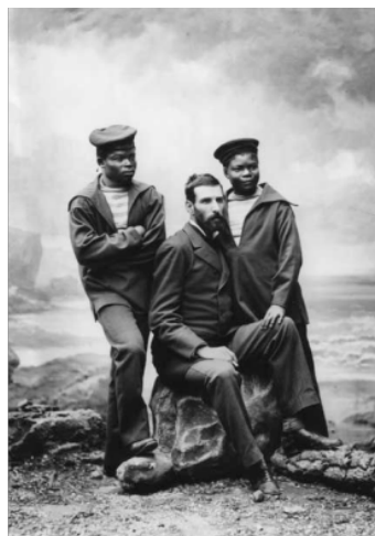
Figura 2 Savorgnan de Brazza

Em outra imagem, cuja existência Barthes não menciona, a jovem mão próxima ao joelho de Brazza passa quase despercebida e encontra-se apoiada junto ao tronco e virilha do explorador; o rapaz o dirige um olhar afetivo; Brazza volta-se inquisidoramente para a câmera; e o terceiro personagem, olhando também para a lente, parece ainda mais deslocado da situação do que na outra fotografia.