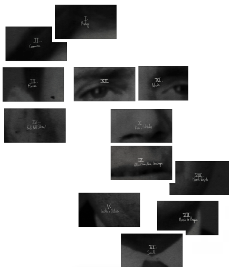
Imagem 1 Colagem a partir de doze fotogramas dos doze cartões de cada um dos capítulos do filme Bostofrio.

Seguindo as sugestões espectro-fetichista de Laura Mulvey, em Death 24x a Second — “A tecnologia digital permite ao espectador congelar um filme de uma maneira que evoca a presença fantasmática do fotograma individual” (2006, 26) —, revi o filme, e comecei a notar uma enorme asa de um nariz, por de baixo da inscrição “VII. Manuel Espada” ou um colarinho de camisa, por de baixo de “VI. Saúl”, ou ainda, a dobra de uma orelha encimada por “III. Maria”.