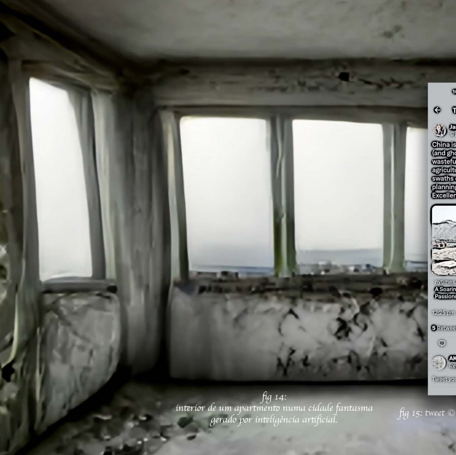
fig 14: interior de um apartamento numa cidade fantasma gerado por inteligência artificial.