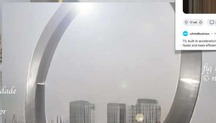
fig 10: © na j