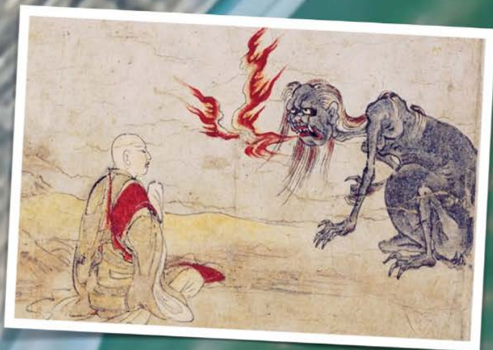
fig11: Mulian confronta a sua mãe fantasma esfomeada no Kyoto Ghosts Scroll, gravura do século XIX