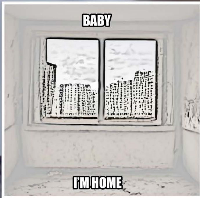
fig 2: meme Baby I'm Home © @angelicismY