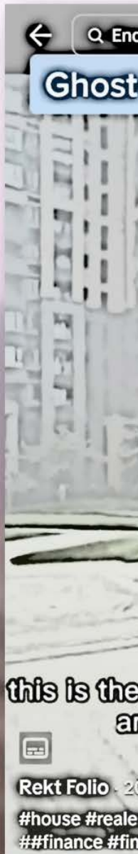
fig 8: