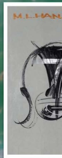
fig. 13: Obra de arte Numa versão futurista autoria da escultora Chen