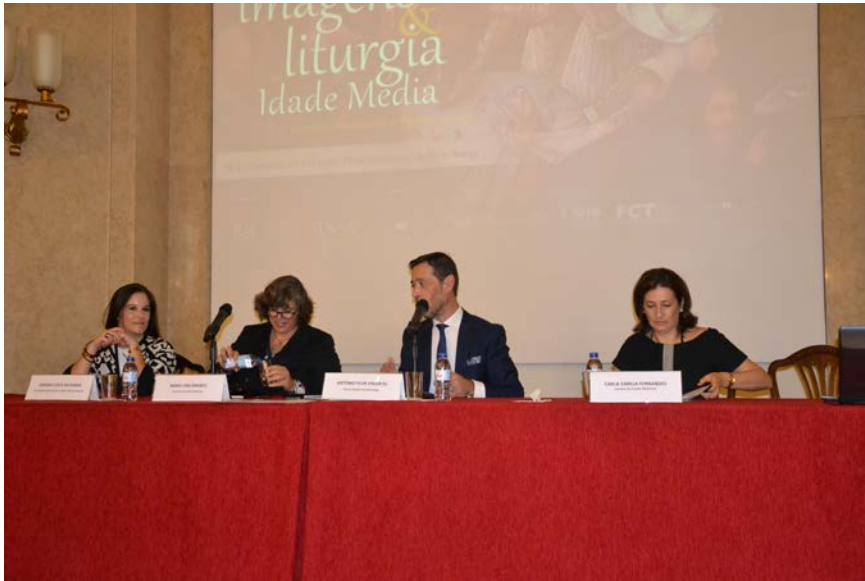
Figura 2 – Sessão de abertura do 3.º Seminário Internacional Imagens e Liturgia na Idade Média