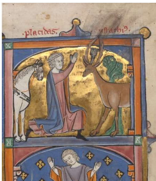
Figura 5: Santo Eustáquio no Decreto de Smithfield, Toulouse, 1300-1340, Royal MS 10 E IV, f. 230r.

These creatures are enemies to serpents. When they feel themselves to be weighed down by illness, they suck snakes from their holes with a snort of the nostrils and, the danger of their venom having been survived, the stags are restored to health by a meal of them 24 .