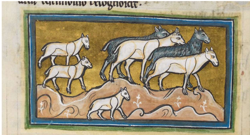
Figura 3: Cordeiros e Ovelhas no Bestiário de Rochester, British Library, Royal MS 12 F XIII, f. 35v.

Cristo, em diversos bestiários, também foi representado como “The Holy Goat” 16 , ou seja, a figura da cabra e a da cabra selvagem, usando como artifício a visão aguçada destes animais: “Because the sharpness of a goat’s eyes is very acute, and they see everything and know men from afar, this symbolizes Our Lord, who is the Lord God of all knowing” 17 .