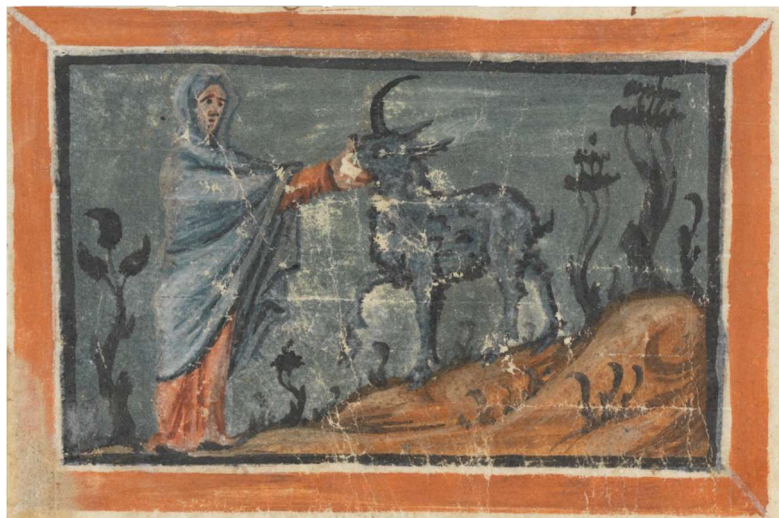
Figura 4: Unicórnio no Physiologus de Berna, século IX, Bern, Burgerbibliothek, Cod. 318, f. 16v.

Esta obra também estabelece uma relação explícita entre o unicórnio e Cristo: “Our Lord Jesus Christ is the spiritual unicorn of whom it is said: “My beloved is like the son of the unicorns” (Ct, 2:9)” 21 . Como símbolo da união e unidade entre Deus e Cristo, o chifre do unicórnio torna-se o chifre da salvação: “The single horn on the unicorn’s head signifies what He Himself said: “I and my Father are one” (John 10:30)” 22 . Assim, como símbolo da cruz de Cristo 23 , o chifre do unicórnio também se relaciona com os chifres do íbex e do antílope, no sentido em que ambos podem ser entendidos como elementos de combate ao mal e ao diabo.