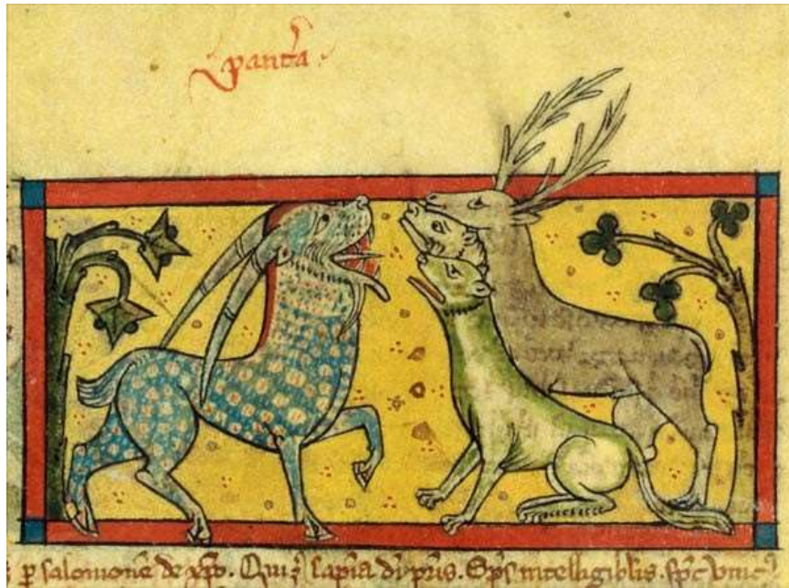
Figura 7: Pantera no Bestiário Lat. 3630 (BnF, lat. 3630, f. 76r).

Ainda que muito ligados ao poder, os chifres não podem ser encarados como forma de individualizar simbolicamente os animais que os possuem. Tal justifica-se, como vimos, através do amplo espectro simbólico atribuído aos animais chifrudos e aos chifres. Numa primeira abordagem, um animal como o unicórnio parecia ser um emblema exclusivamente positivo durante a Idade Média, enquanto o bode aparentava ser unicamente negativo. No entanto, a mentalidade medieval recorreu a diferentes tradições para compor as narrativas alegóricas animais e, por isso, tais alegorias são passíveis de várias interpretações dependendo dos seus contextos e da finalidade de cada texto produzido. Assim, o unicórnio pode simbolizar Cristo a partir do seu sacrifício e do poder atrativo exercido pela Virgem, mas pode também ser símbolo da vaidade, do amor cortês e, até, da morte, como no caso da história dos Santos Barlaão e Josafá. O bode, por sua vez, relaciona-se com o pecador, com a luxúria, com os desvios morais, mas também pode ser associado à fertilidade.