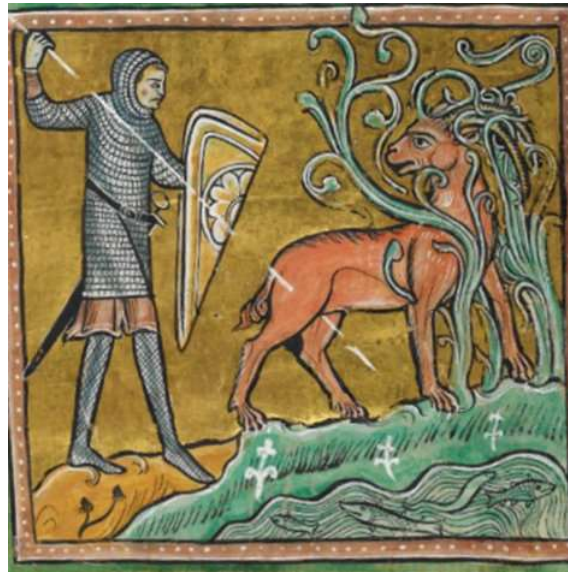
Figura 2: Antílope no Bestiário de Rochester, British Library, Royal MS 12 F XIII, f. 9v.

Além de expor os chifres como atributos de combate ao mal, as narrativas dos bestiários estabelecem, com bastante frequência, uma relação entre os animais que os possuem, Cristo e os fiéis da Igreja. Uma das mais constantes é feita a partir do sacrifício, como no caso dos bovinos. Na cultura Egípcia, ou na Greco-Romana, as figuras bovinas foram incorporadas nas representações de diferentes divindades, como Amón, o Touro celestial 5 , e tais animais eram encarados especialmente como holocaustos. A Idade Média adaptou esses simbolismos de acordo com a doutrina cristã, convertendo os bovinos em signos, estabelecendo uma analogia com o sacrifício de Cristo. Todavia, à semelhança de muitos dos animais nos bestiários, outras atribuições simbólicas são possíveis e, por vezes, completamente opostas. O touro, por exemplo, em primeiro lugar pode representar Cristo pela associação à sua força: “Their fierceness is such that if they are captured they give up the ghost. The bull is Christ” 6 . Por outro lado, pode ainda representar o orgulho dos príncipes: “Elsewhere bulls are the princes of this world, tossing the commom people on the horns of their pride” 7 , tal como os búfalos, que também representam o orgulho.