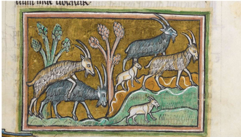
Figura 6: Bodes no Rochester Bestiary, British Library, Royal MS 12 F XIII, f. 36r.

tears of penitence) dissolves the hardness of his sins” 30 . O MS Bodley 764 apresenta de forma clara o simbolismo do bode como um pecador que se entrega à luxúria e completa: “The goats are the sinners of Gentiles. [...] The he-goats are those who follow the depravities of the devil and clothe themselves in the shaggy hide of vice” 31 .